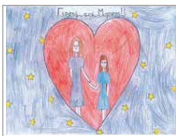
May Μάιος 2021