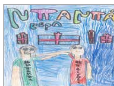
September Σεπτέμβριος 2019